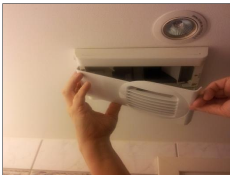
1. Ta ned ventilasjonsdekselet for vask