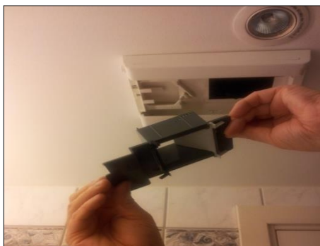
3. Ta ut spjeldet for vask