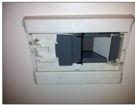
2. Under sitter et spjeld som styres av en fuktindikator som sitter i rammen